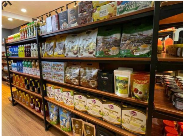
Foto: Aktiviti pemasaran secara online dan fizikal yang telah dijalankan.