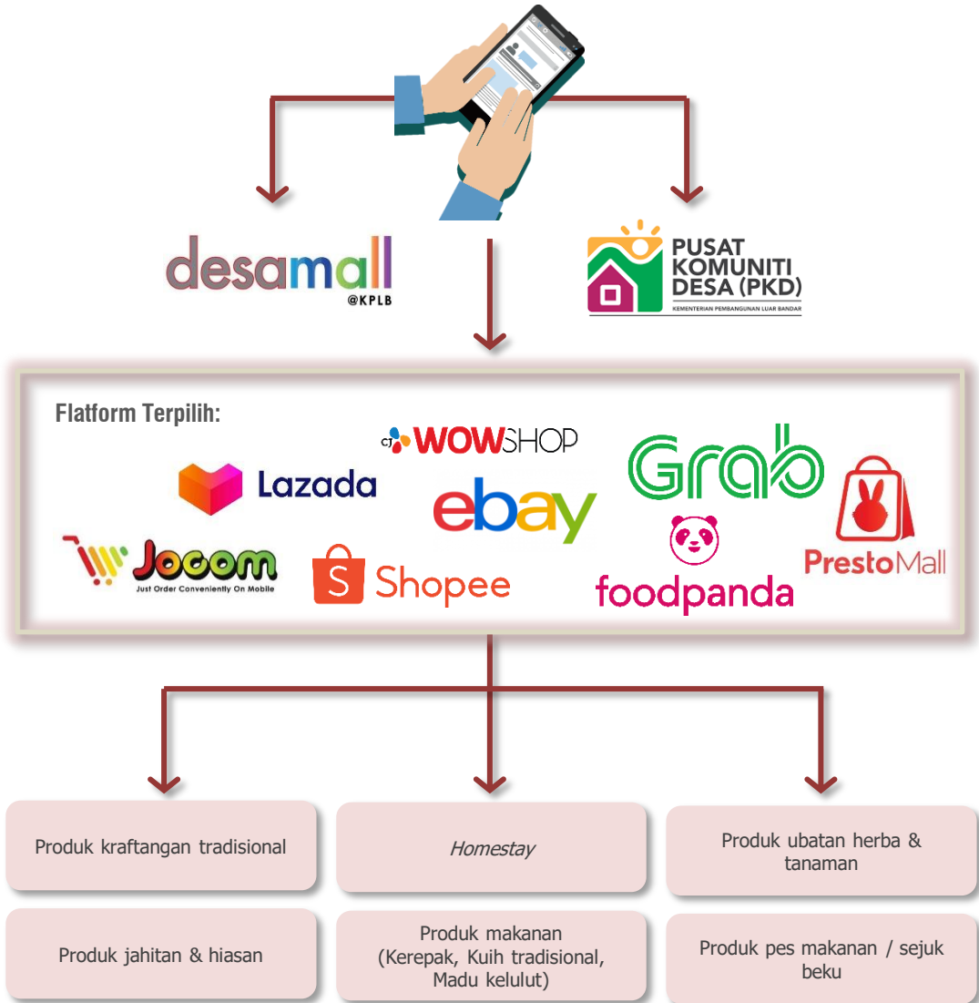
Rajah 4.54: Cadangan Pembangunan Program e-Dagang ' Desamall '