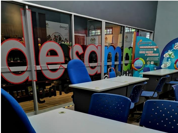
Foto: Pelaksanaan program Desamall di PKD Air Merah, Mersing oleh KPLB.