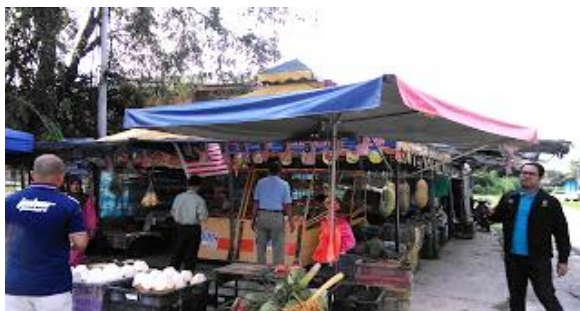
Foto: Contoh GBBS Sediada