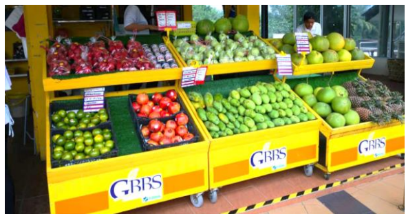
Foto: Cadangan Menaik taraf Gerai GBBS