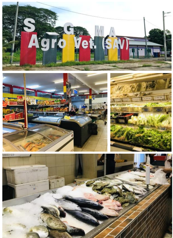
Foto: Pusat Agrovet di Bandar Segamat merupakan pusat jualan agrovet, pengumpulan dan kelangan hasil pertanian dan ternakan. Ia turut berfungsi sebagai mini pasaraya yang menyediakan keperluan harian penduduk seperti jualan hasil ternakan, ikan, sayur-sayuran dan makanan sejuk beku.