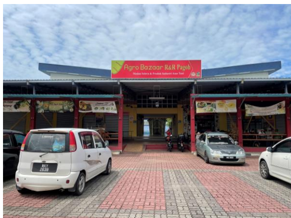
Foto: Agro Bazaar R&R Pagoh.

Sumber: Kajian PHS Desa Negeri Johor (Fasa 3: Johor Utara), 2021