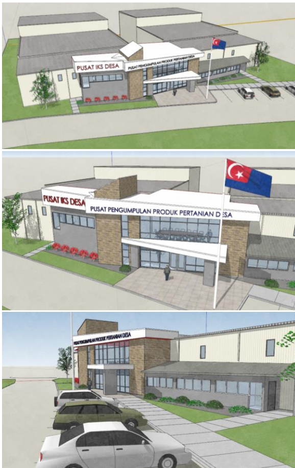
Ilustrasi 4.51: Cadangan pembangunan Pusat Pengumpulan Produk Pertanian Desa