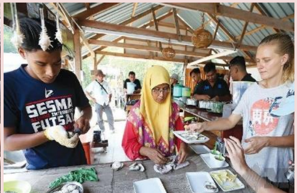
Foto: Aktiviti dan proses penternakan kehidupan yang bernilai ini juga berpotensi menarik perhatian pelancong sehingga ke peringkat antarabangsa.