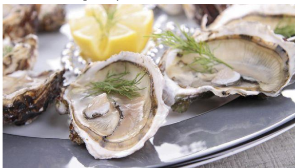
Foto: Tiram yang mempunyai permintaan tinggi dari hotel-hotel ternama dan restoran makanan laut.