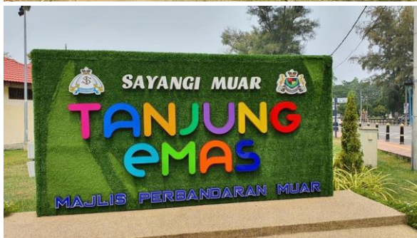
Foto: Contoh bentuk arca yang dibangunkan di Bandar Muar bagi penjenamaan pelancongan Daerah Muar