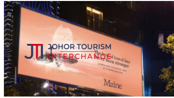
Foto: Contoh penggunaan LED screen