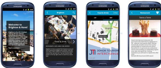
Foto: Penggunaan Tourism Apps dalam pemasaran dan promosi aktiviti pelancongan.