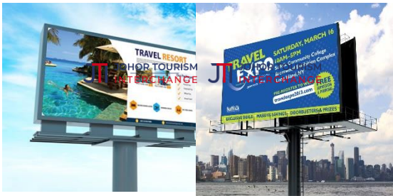
Foto: Contoh bentuk pengiklanan billboard yang digunakan bagi mempromosikan pelancongan.

Pemasangan papan iklan elektronik atau billboard di tepi lebuh raya dan persimpangan jalan merupakan antara alat promosi yang berkesan bagi menarik pengunjung ke sesuatu destinasi atau penyertaan dalam penganjuran acara pelancongan.