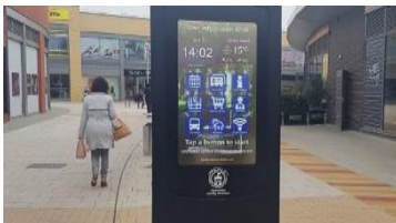
Foto: Contoh penggunaan kios digital