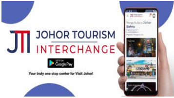
Foto: Contoh penggunaan mobile apps