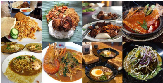
Foto: Festival Makanan Johor serta terdapat kraftangan dan ukiran kayu