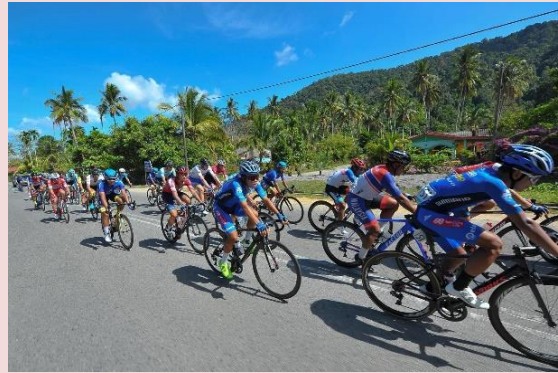
Foto: Acara Berbasikal di Pulau Langkawi

LTDL yang kini dikenali sebagai PETRONAS Le Tour de Langkawi 2020 sudah banyak meninggalkan impak positif, terutamanya mengambil kira 232 peringkat perlumbaan yang pernah dianjurkan di pelbagai lokasi di seluruh tanah air.