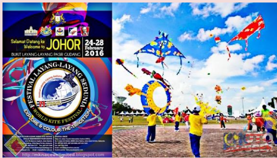
Foto: Festival Layang-Layang Dunia, Hallmark Event di Johor