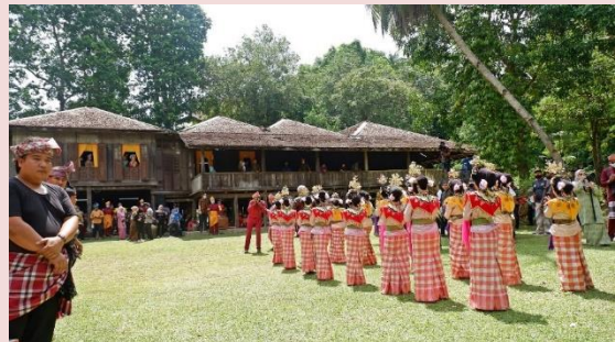
Foto: Festival Kesenian Kebudayaan, Kg. Budaya Terengganu