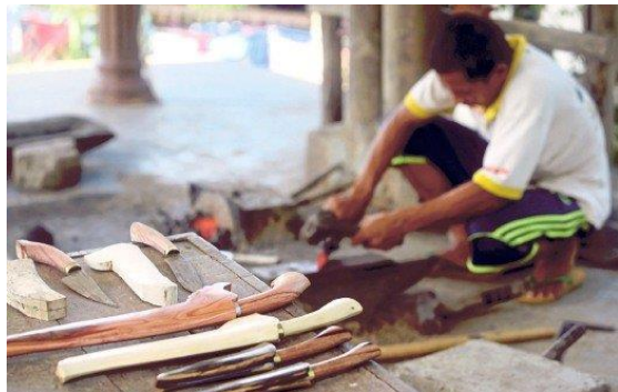
Foto: Demonstrasi Pembuatan Parang