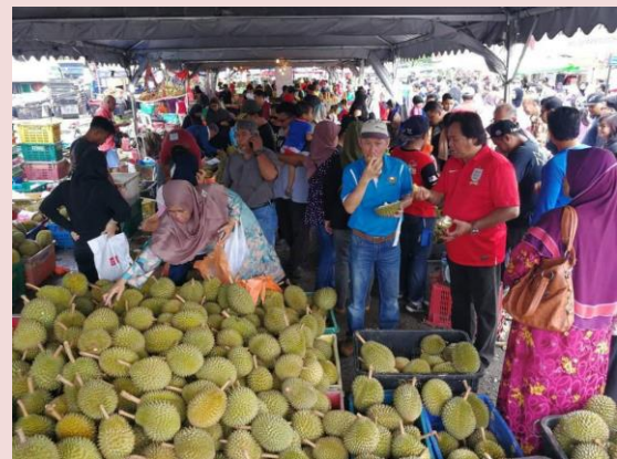
Foto: Pesta Lelong Buah-Buahan tempatan di Ulu Tiram, Johor