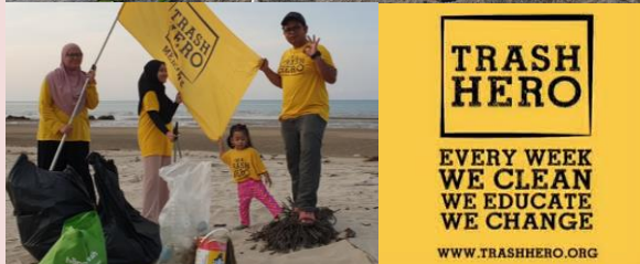
Foto: Kempen kutip sampah sambil beriadah bersama keluarga di kawasan pantai di Mersing.