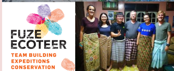
Foto: Pakej pelancongan homestay bersama penduduk dengan aktiviti mengutip sampah di sepanjang pantai, Pulau Perhentian.

Program Trash Hero Malaysia di Mersing merupakan inisiatif pihak PBT dan Pejabat Daerah bersama NGO bagi kempen kutip sampah sambil riadah.