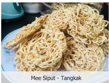
Mee Siput - Tangkak