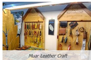
Muar Leather Craft