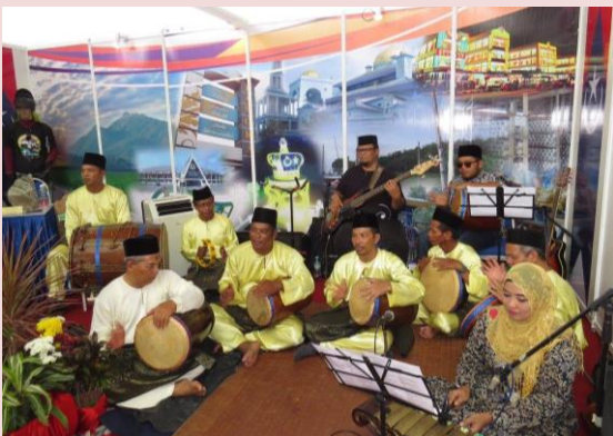
Foto: Persembahan Kumpulan Kempling Parit Kassan Tangkak