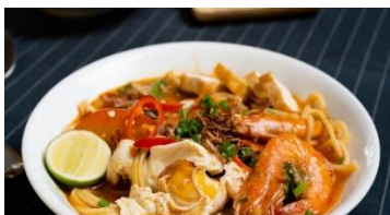
Mee Bandung Muar