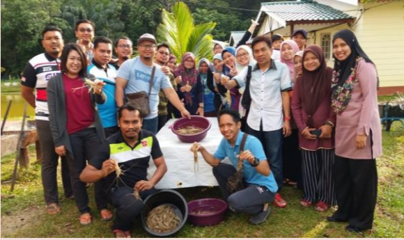
Foto: Pelancong yang datang dapat membeli udang dan ikan yang segar di Lembah Salam

Lembah Salam merupakan sebuah pusat akuakultur pelancongan ( Aqua-Tourism ) yang mempunyai fasiliti seperti Hatchery (Pusat Pembiakan Ikan dan Udang), Kolam Ternakan Udang Galah, Kolam Mandi, Kolam Pancing Udang Galah, Homestay dan Platform Aktiviti Outdoor ( Obstacles, Jungle Trekking, Abseiling, Survival, Water Confident, Rafting, Flying Fox, Interactive Game dan lain-lain.)