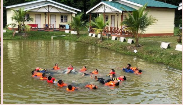
Foto: Aktiviti Team Building di Lembah Salam

Sehubungan itu, kawasan tarikan pelancongan di kawasan desa yang berpotensi perlu dibangunkan sebagai kawasan pelancongan berkonsepkan aqua tourism . Kawasan ini bukan sahaja akan menjana ekonomi melalui hasil produktiviti perikanan, malahan dapat menjana hasil pendapatan melalui aktiviti pelancongan. Berikut merupakan antara usaha yang dilakukan oleh pengusaha resort (contoh Desa Keroma Eco Resort, Muar) melalui konsep pelancongan aqua tourism ini.