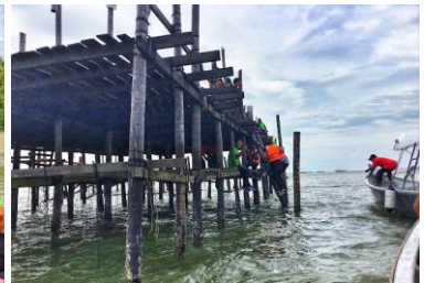
Foto: Melawat tempat ternakan tiram