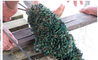
Foto: Melawat tempat ternakan tiram