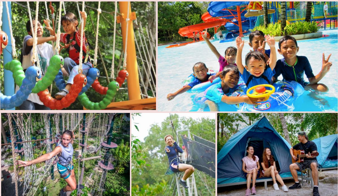
Foto: Antara aktiviti menarik yang sesuai untuk pelbagai peringkat umur untuk tarikan pelancong.

Penang Escape Theme Park yang terletak di Teluk Bahang, Pulau Pinang merupakan sebuah taman tema unik yang memiliki taman tema dan sukan air yang dikelilingi dengan persekitaran semula jadi. Terdapat 30 aktiviti yang disediakan antaranya tubby tunnel , wave ball , three sixty , tubby racer , jungle swinger dan lain-lain.