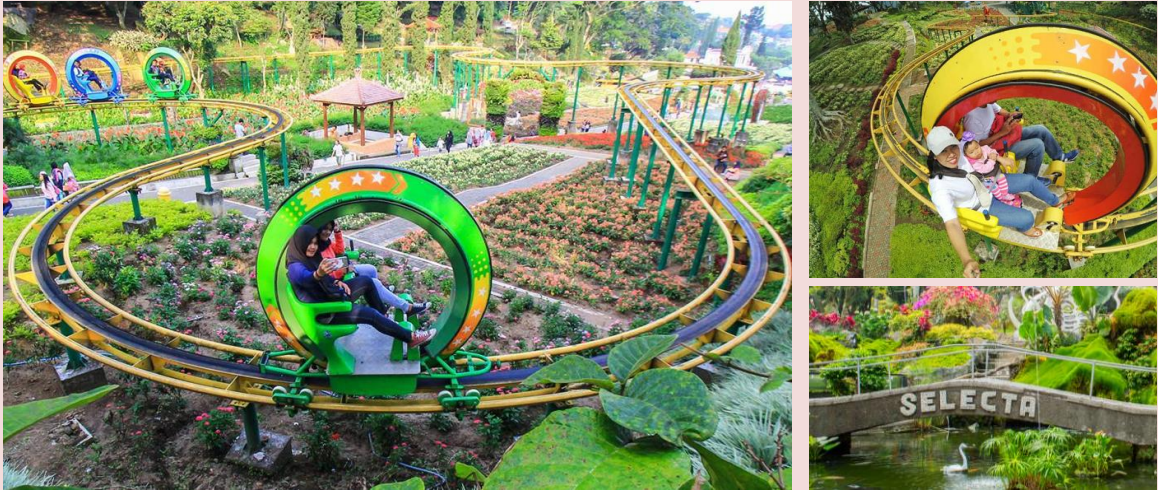
Foto: Antara aktiviti menarik yang menarik pengunjung. Sumber: https://indonesia.tripcanvas.co/malang/family-attractions/

Selecta Agro Park, Batu Malang, Indonesia merupakan Taman Tema Agro yang popular di Indonesia, di mana berjaya menarik pelancong domestik dan antarabangsa untuk ke taman tema berkonsepkan buah-buahan dan pertanian. Daerah Batu Malang merupakan daerah pengeluar buah-buahan terbesar di Jawa Timur, Indonesia. Antara aktiviti lain adalah 4D cinema , memetik buah dan lain-lain.