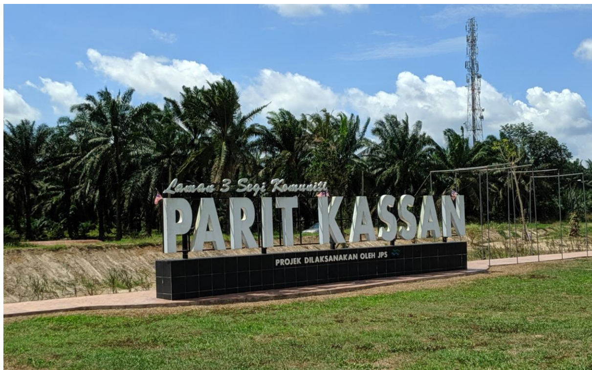
Foto: Laman 3 Segi Komuniti Parit Kassan, Tangkak

Sumber: Kajian PHS Desa Negeri Johor (Fasa 3: Johor Utara), 2021