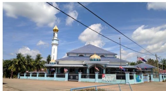
Foto: Masjid Al-Azim, Kg. Simpang 5 Darat, Tangkak

Sumber: Kajian PHS Desa Negeri Johor (Fasa 3: Johor Utara), 2021