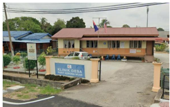
Foto: Klinik Desa Parit Keroma, Muar

Sumber: Kajian PHS Desa Negeri Johor (Fasa 3: Johor Utara), 2021