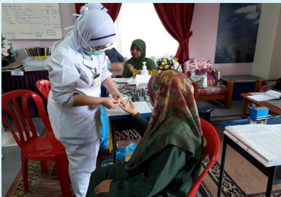
Foto: Pemeriksaan Kesihatan Masyarakat Desa