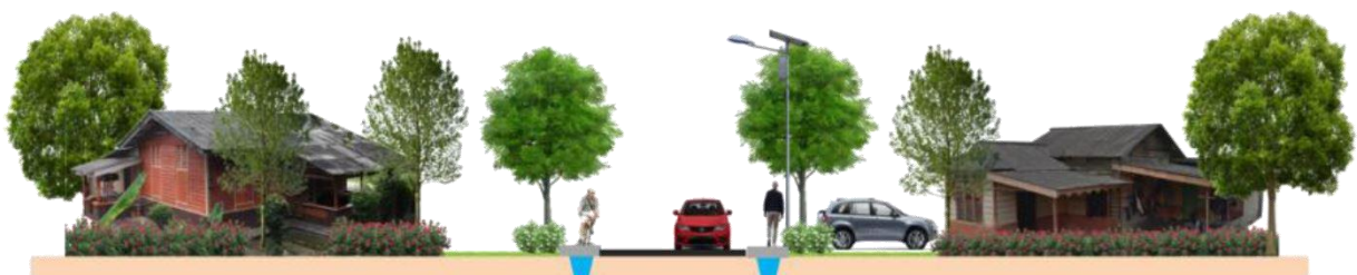
Foto: Contoh Gambaran Landskap

Sumber: Kajian PHS Desa Negeri Johor (Fasa 3: Johor Utara), 2021