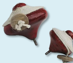
Foto: Gasing Tradisional