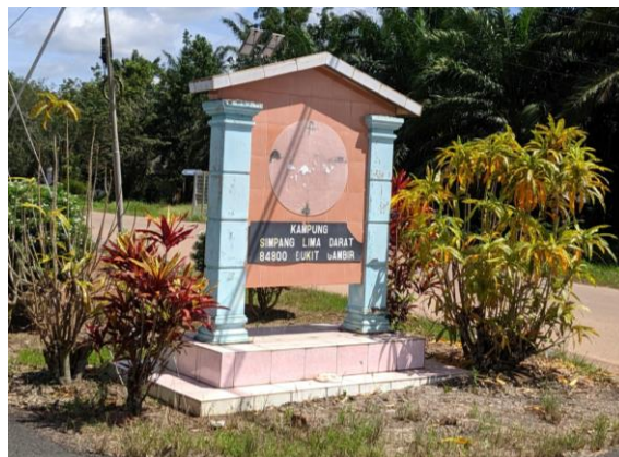
Foto: Mercu tanda Kg. Simpang 5 Darat sebelum dinaiktaraf