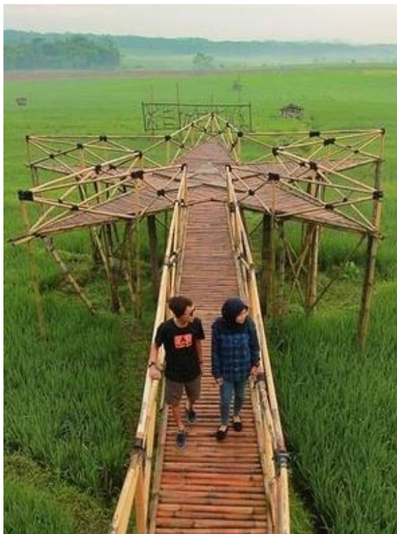
Foto: Wisata Sawah di Pantai Labu, Indonesia