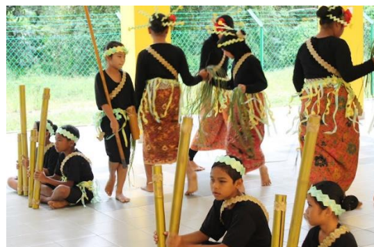
Foto: Tarian Sewang, Bekok, Kg. Kudong, Segamat