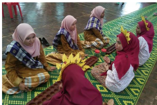
Foto: Permainan Congkak di SMK Seri Kenangan Segamat