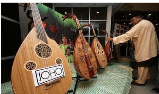
Foto: Pertandingan Gazal tahun 2009 Sumber: Facebook, Persatuan Johor, 2019