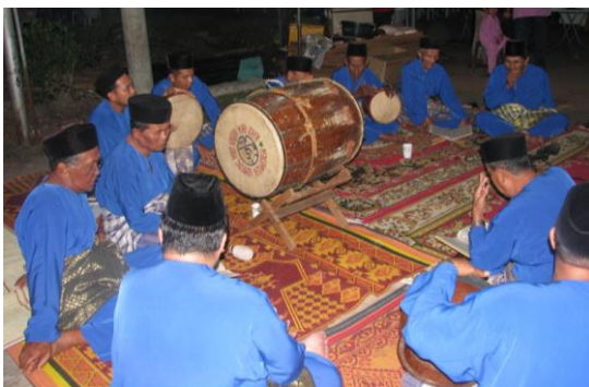
Foto: Aktiviti Kemplingan di Kg. Parit Kassan, Bukit Gambir

Sebagai sebuah negara yang mempunyai pelbagai bangsa dan budaya, Malaysia merupakan negara yang mempunyai pelbagai seni budaya dan kesan tinggalan sejarah yang perlu diwarisi. Kepelbagaian kaum di Malaysia mencorakkan perbezaan budaya dari aspek pakaian, makanan, seni muzik, perayaan, permainan dan lain-lain. Tamadun sesuatu bangsa dapat dilihat pada warisan seni budayanya. Cadangan ini turut membuka peluang terhadap pekerjaan seterusnya menyokong ekonomi dalam kawasan desa Johor.