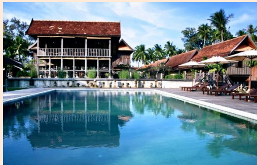
Foto: Kepelbagaian Kemudahan Sokongan