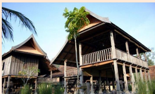
Foto: Reka Bentuk Rumah Tradisional Terrapuri Village