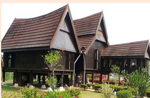
Foto: Reka Bentuk Rumah Tradisional Sekitar Homestay Lonek