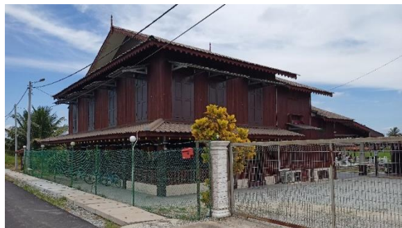
Foto: Perumahan Tradisional Melayu di Kg. Sungai Balang Besar, Muar