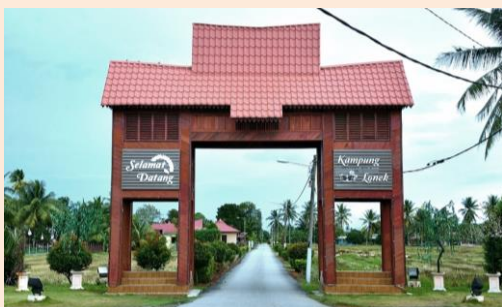
Foto: Reka Bentuk Pintu Gerbang Homestay Lonek

Pembangunan resort ini dibantu oleh beberapa inisiatif daripada pihak kerajaan dengan penawaran faedah serta bantuan dalam meneruskan perusahaan yang menekankan unsur tradisional melayu. Dengan penawaran inisiatif ini ia dapat menarik minat pengusaha untuk turut terlibat dalam pembangunan perumahan tradisional ini bagi menyokong sektor pelancongan di dalam kawasan desa.