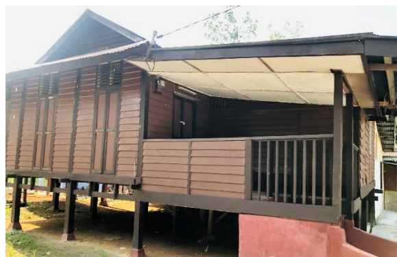
Foto: Perumahan Tradisional Melayu di Kg. Tekam, Segamat

Sumber: Kajian PHS Desa Negeri Johor (Fasa 3: Johor Utara), 2021