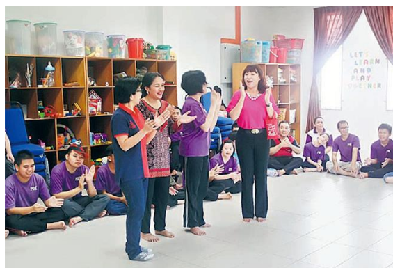
Foto: Aktiviti Sosial Bagi Tujuan Pemulihan dan Rawatan