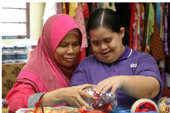
Foto: Aktiviti Kemahiran Bagi Golongan OKU dan Ibu Tunggal Sumber: Jabatan Kebajikan Masyarakat, 2018

Sumber: Kajian PHS Desa Negeri Johor (Fasa 3: Johor Utara), 2021