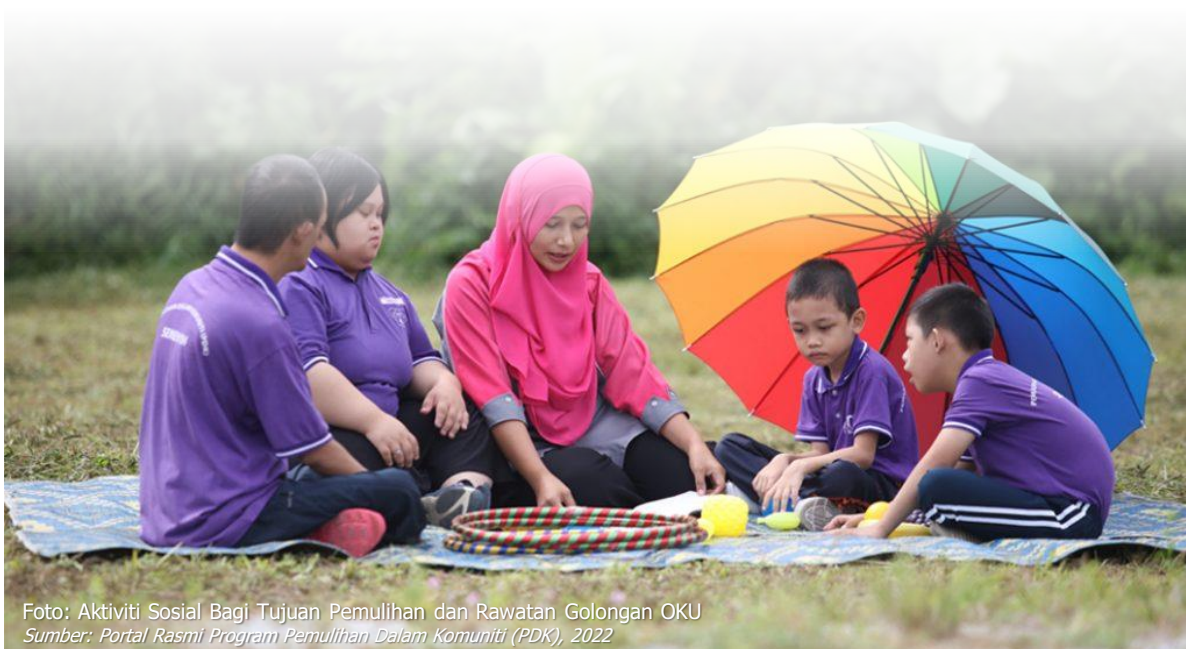
Foto: Aktiviti Sosial Bagi Tujuan Pemulihan dan Rawatan Golongan OKU Sumber: Portal Rasmi Program Pemulihan Dalam Komuniti (PDK), 2022

Sumber: Kajian PHS Desa Negeri Johor (Fasa 3: Johor Utara), 2021