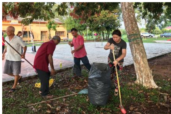
Foto: Aktiviti gotong-royong KRT Sagil, Tangkak

Rewang lebih menjurus kepada aktiviti yang dilakukan bersama-sama dalam bentuk kumpulan agak besar secara bergotong royong untuk menguruskan sesuatu majlis atau kenduri. Amalan yang sememangnya terkenal dalam masyarakat kampung ini mempunyai pelbagai manfaat selain daripada mewujudkan sikap kerja sama dan tolong menolong.