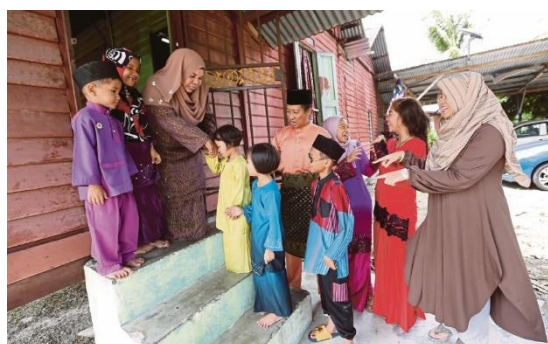
Foto: Amalan ziarah-menziarahi sempena perayaan