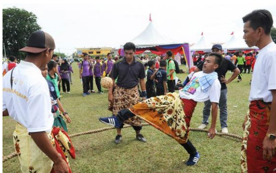
Foto: Festival sukan dapat memupuk perpaduan masyarakat