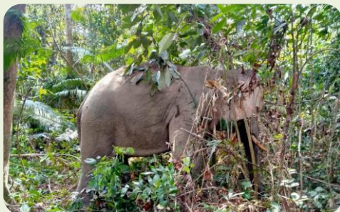
Foto: Susulan pemantauan Jabatan PERHILITAN Negeri Johor di Kg. Tenang, Segamat.