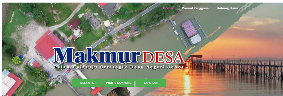
Foto: Penyelarasan data aduan gangguan hidupan liar di antara sistem Jabatan PERHILITAN dengan Sistem Makmur Desa.