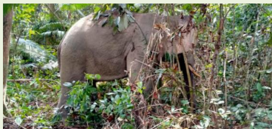
Foto: Isu gangguan gajah di Kg. Felda Tenang, Segamat Johor