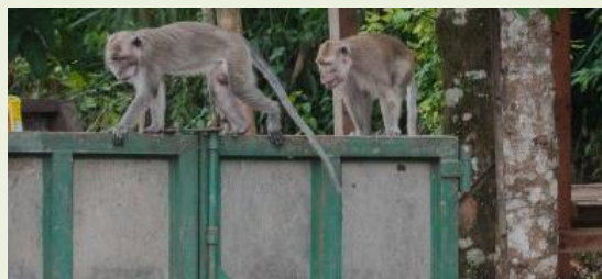
Foto: Isu gangguan kera di Kg. Seri Menanti, Muar