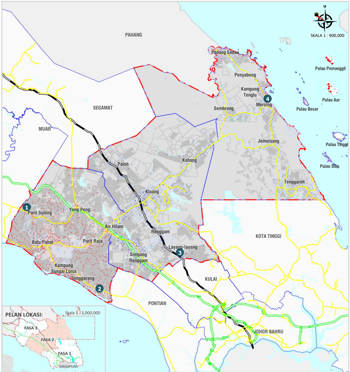
Rajah 4.68: Cadangan Pusat Inkubator Johor Tengah