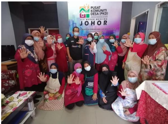
Foto: Aktiviti yang dijalankan oleh PKD di Mersing