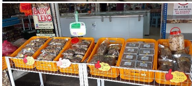
Foto: Antara aktiviti dan produk yang dihasilkan di dalam program-program di bawah Pusat Komuniti Desa