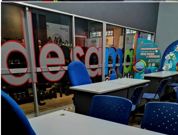
Foto: Pelaksanaan program Desamall di PKD Air Merah, Mersing oleh KPLB.