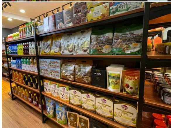
Foto: Aktiviti pemasaran secara online dan fizikal yang telah dijalankan.