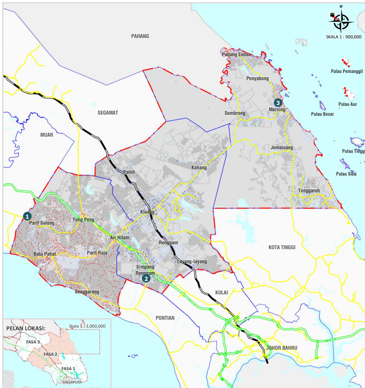
Rajah 4.69: Cadangan Program Desamall@KPLB di Johor Tengah