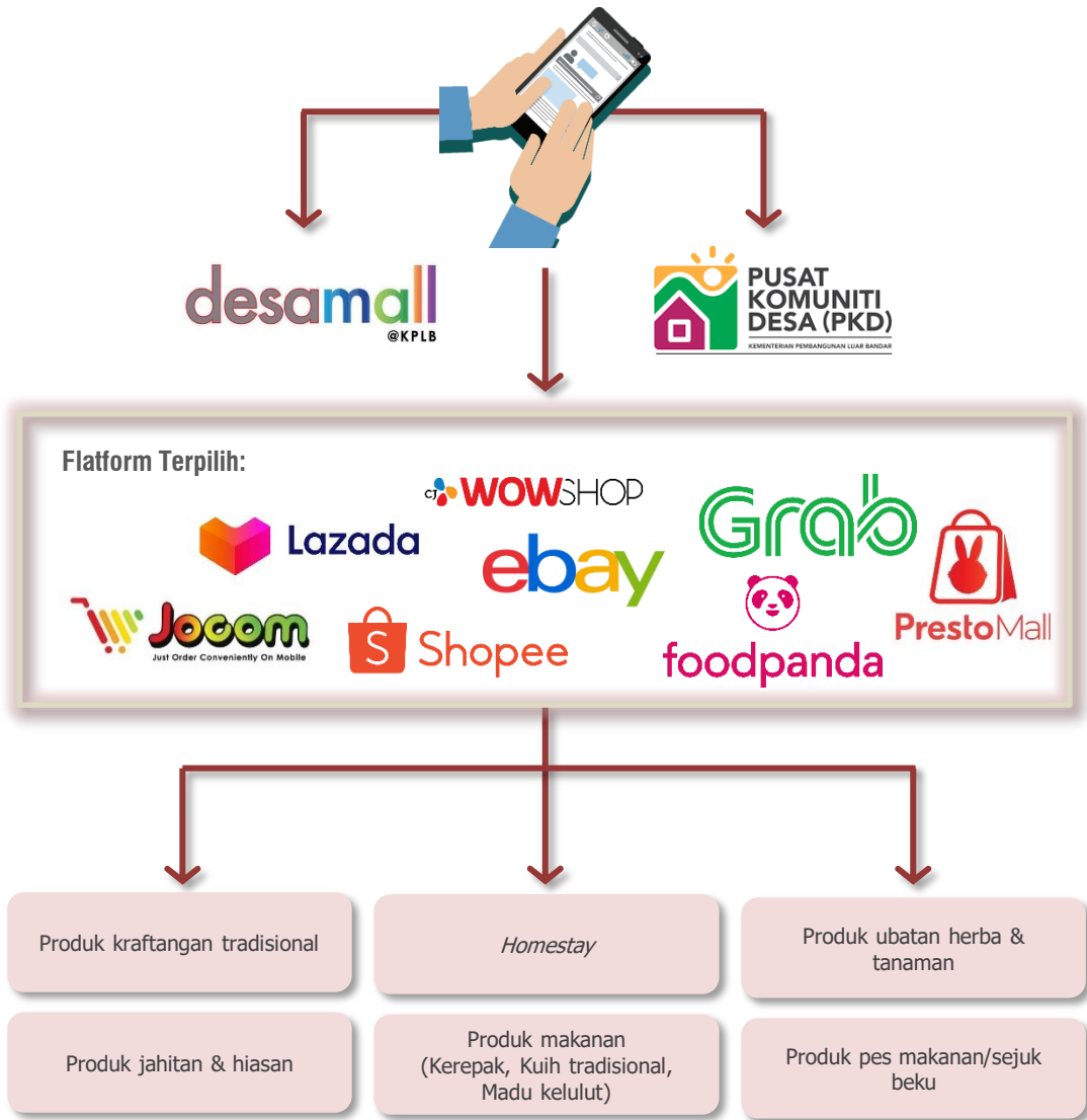
Rajah 4.65: Cadangan Pembangunan Program e-Dagang 'Desamall'