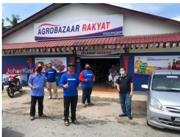
Foto: Agro Bazaar Rakyat di Kg. Seri Rejo Sari, Batu Pahat