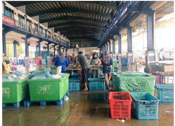
Foto: Pusat Pendaratan Ikan di LKIM Endau, Mersing.