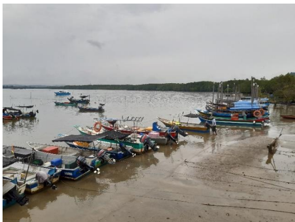
Foto: Tempat letak bot semasa nelayan di Teluk Buih, Mersing

Sumber: Kajian PHS Desa Negeri Johor (Fasa 2: Johor Tengah), 2020