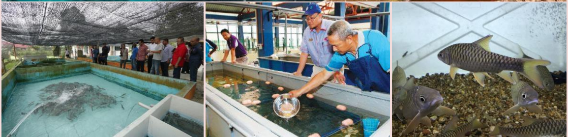
Foto: Projek usahasama pembenihan dan ternakan ikan kelah antara Jabatan Perikanan Malaysia dan Far East Planet di Kg. Air Merah, Mersing.