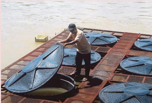
Foto: Contoh kaedah penternakan ikan keli organik menggunakan kanvas.