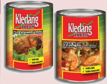
Foto: Contoh produk hiliran ikan keli pekasam dan produk masakan keli (dalam tin).