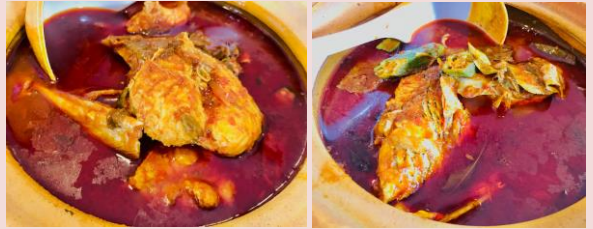
Foto: Tarikan asam pedas ikan sungai seperti ikan baung di Daerah Kluang.