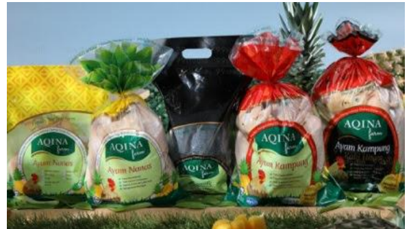
Foto: Contoh produk ayam kampung organik yang telah siap diproses untuk dijual.