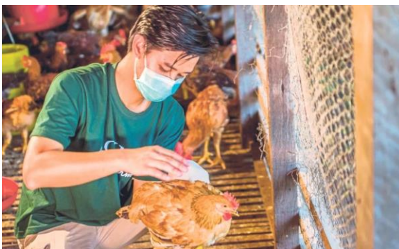
Foto: Penjagaan ayam kampung organik