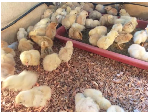
Foto: Anak ayam kampung organik berusia seminggu