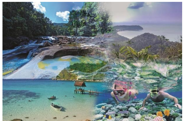
Foto: Daerah Mersing terkenal dengan aktiviti pelancongan eko, pulau-pulau dan kawasan pantai.