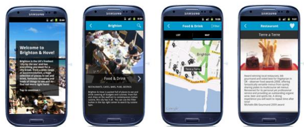
Foto: Penggunaan Tourism Apps dalam pemasaran dan promosi aktiviti pelancongan.