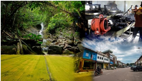
Foto: Daerah Kluang terkenal dengan aktiviti pelancongan eko dan sejarah warisan.

Memperkenalkan jenama pelancongan desa bagi setiap daerah untuk memajukan sektor pelancongan dan pelaburan setempat dan pada masa yang sama untuk mempromosikan daerah sebagai lokasi yang bersesuaian untuk pelancongan.