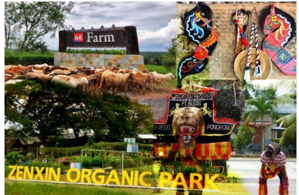
Foto: Daerah Batu Pahat terkenal dengan aktiviti pelancongan agro, budaya dan warisan.