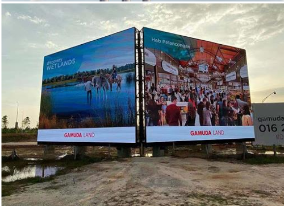
Foto: Contoh bentuk pengiklanan billboard yang digunakan bagi mempromosikan destinasi pelancongan.