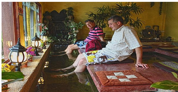
Foto: Fish Spa di Batu Feringgi, Pulau Pinang