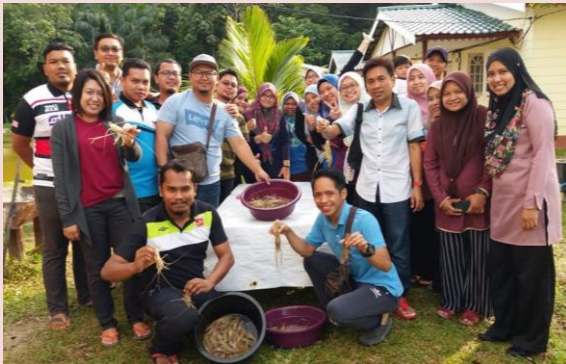
Foto: Pelancong yang datang dapat membeli udang dan ikan yang segar di Lembah Salam

Lembah Salam merupakan sebuah pusat akuakultur pelancongan ( Aqua Tourism ) yang mempunyai fasiliti seperti Hatchery (Pusat Pembiakan Ikan/Udang), Kolam Ternakan Udang Galah, Kolam Mandi, Kolam Pancing Udang Galah, Homestay dan Platform Aktiviti Outdoor ( Obstacles, Jungle Trekking, Abselling, Survival, Water Confident, Rafting, Flying Fox, Interactive Game dan lain-lain.)