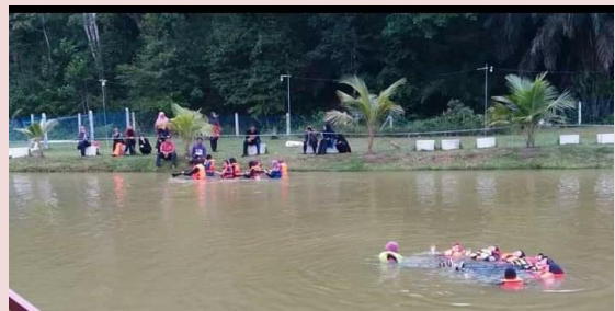
Foto: Salah satu aktiviti team building yang ada di Lembah Salam