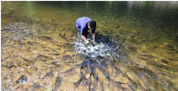
Foto: Fish feeding di Kelah Santuari, Tasik Kenyir Sumber: http://denai.my/fish-spa-di-santuari-kelah-tasik-kenyir/kelah-sanctuary/