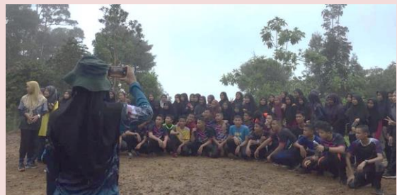
Foto: Salah satu aktiviti team building yang ada di Lembah Salam Sumber: Laman media sosial facebook/LembahSalam