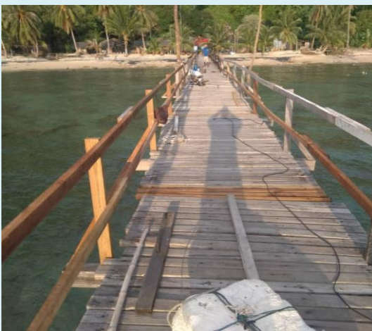
Foto: Keadaan Semasa Jeti Kayu Pulau Aur

Jeti Kayu Pulau Aur menyediakan perkhidmatan feri kepada penduduk dan pelancong luar. Cadangan menaik taraf jeti kayu ini akan memberi keselesaan kepada pengguna dan penduduk desa kawasan tersebut.