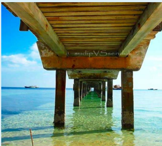
Foto: Antara keadaan semasa jeti di kawasan Pulau Aur, Pulau Tinggi dan Pulau Pemanggil.