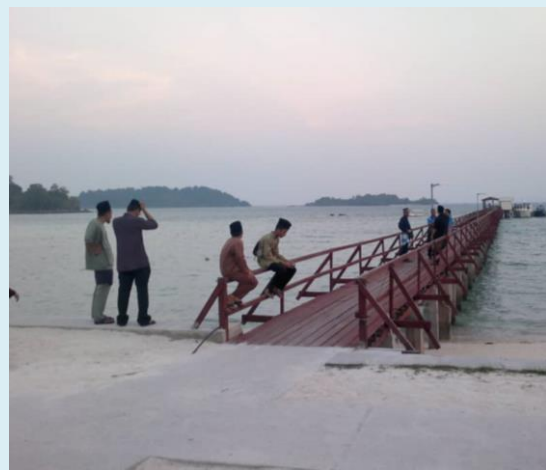
Foto: Keadaan Semasa Jeti Kayu Pulau Tinggi

Jeti Kayu Pulau Aur menyediakan perkhidmatan feri kepada penduduk dan pelancong luar. Cadangan menaik taraf jeti kayu ini akan memberi keselesaan kepada pengguna dan penduduk desa kawasan tersebut.