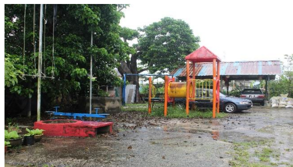
Foto: Taman Permainan Kg. Baru Sri Lalang, Kluang