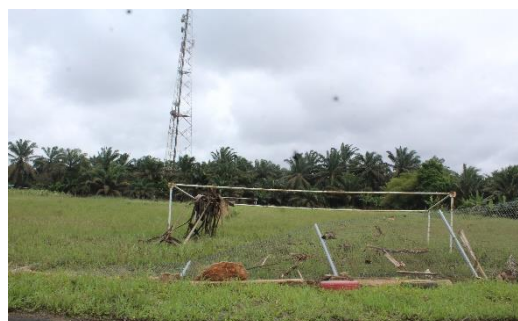
Foto: Padang Kg. Contoh, Kluang