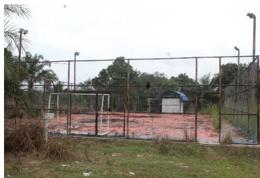
Foto: Gelanggang Futsal Kg Orang Asli Punjut, Kluang