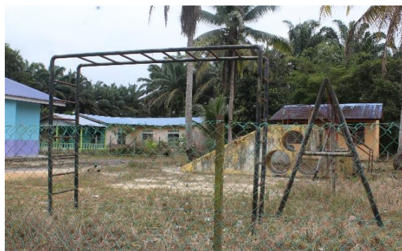
Foto: Taman Permainan Kg Orang Asli Punjut, Kluang

Sumber: Kajian PHS Desa Negeri Johor (Fasa 2 : Johor Tengah), 2020