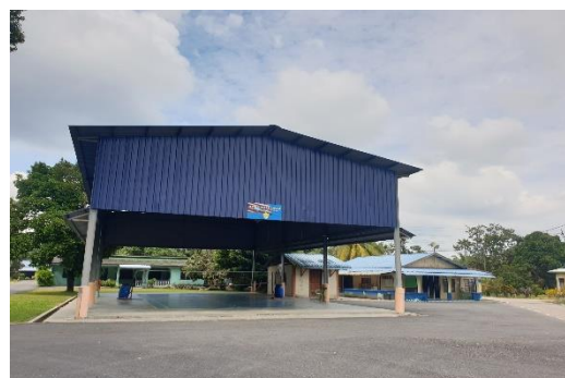
Foto: Gelanggang Badminton, Kg. Parit Kangkar