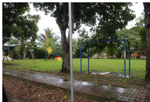
Foto: Taman Permainan Kg. Melayu Niyor, Kluang