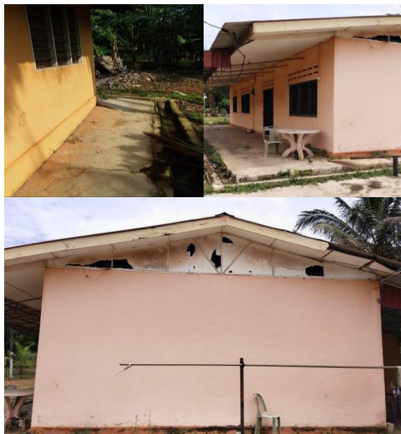
Foto: Balai Raya Kampung Haji Kamisan, Batu Pahat