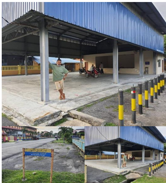
Foto: Dewan Terbuka Jalan Talib Abu, Batu Pahat