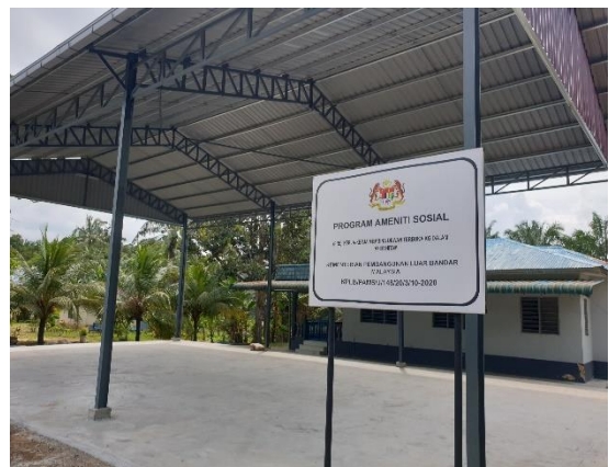
Foto: Dewan Terbuka Kg. Dalam, Ayer Hitam, Batu Pahat