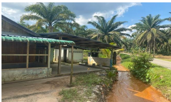
Foto: Surau Al-Hidayah Di Kampung Parit Hj Ahmad