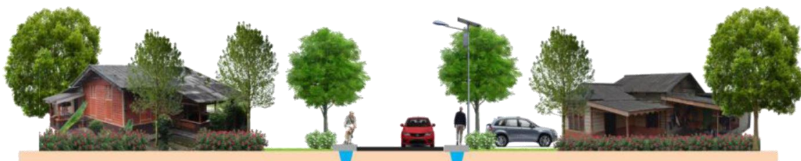
Foto : Contoh Gambaran Landskap