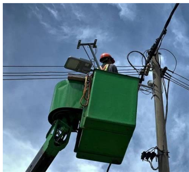
Foto: Contoh Permohonan dan Penggunaan Lampu Jalan LED, TNB