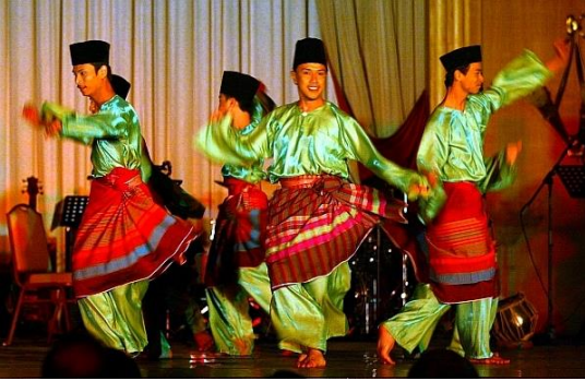
Foto: Tarian Zapin Tenglu berasal daripada Mersing

Sebagai sebuah negara yang mempunyai pelbagai bangsa dan budaya, Malaysia merupakan negara yang mempunyai pelbagai seni budaya dan kesan tinggalan sejarah yang perlu diwarisi. Kepelbagaian kaum di Malaysia mencorakkan perbezaan budaya dari aspek pakaian, makanan, seni muzik, perayaan, permainan dan lain-lain. Tamadun sesuatu bangsa dapat dilihat pada warisan seni budayanya. Cadangan ini turut membuka peluang terhadap pekerjaan seterusnya menyokong ekonomi dalam kawasan desa Johor.