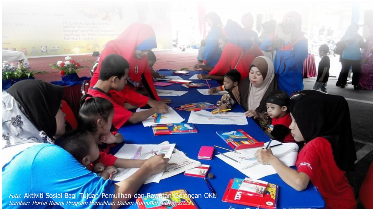
Foto: Aktiviti Sosial Bagi Tujuan Pemulihan dan Rawatan Golongan OKU Sumber: Portal Rasmi Program Pemulihan Dalam Komuniti (PDK), 2022

Sumber: Kajian PHS Desa Negeri Johor (Fasa 2: Johor Tengah), 2020