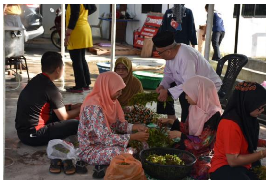
Foto: Aktiviti rewang agihan bubur lambuk di Mersing

Rewang lebih menjurus kepada aktiviti yang dilakukan bersama-sama dalam bentuk kumpulan agak besar secara bergotong royong untuk menguruskan sesuatu majlis atau kenduri. Amalan yang sememangnya terkenal dalam masyarakat kampung ini mempunyai pelbagai manfaat selain daripada mewujudkan sikap kerja sama dan tolong menolong.