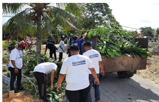
Foto: Gotong-royong kawasan perkuburan di Batu Pahat