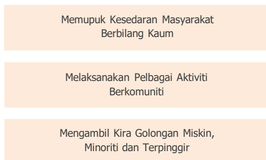
Rajah 6.1: Langkah Membentuk Perpaduan Masyarakat