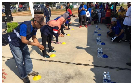
Foto: Festival sukan rakyat di Kluang