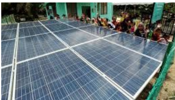
Foto: Pemasangan Solar Panel di Kampung Orang Asli Pucur, Mersing dapat membantu bekalan elektrik kepada komuniti.