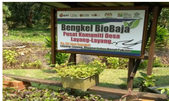
Foto: Pemasangan Solar Panel di Kampung Orang Asli Pucur, Mersing dapat membantu bekalan elektrik