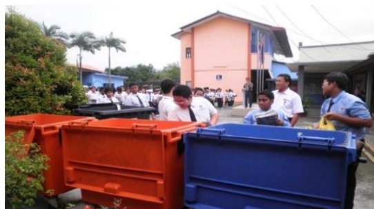
Foto: Kempen kitar semula di Sekolah Rendah Montfront, Batu Pahat.

Sumber: Artikel Berita Harian BHOnline, 2017