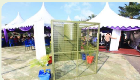
Foto: Contoh perangkap kera bersaiz 8' x 8' x 8'.