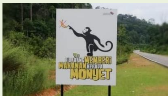
Foto: Papan tanda larangan memberi makanan kepada monyet bagi mengurangkan kacau ganggu kera liar di laluan sepanjang jalan dilaksanakan di Daerah Mersing.