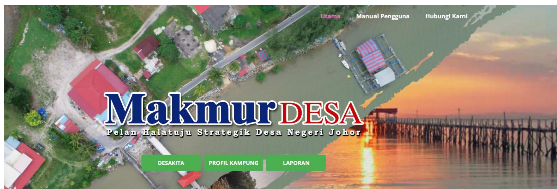
Foto: Penyelarasan data aduan gangguan hidupan liar di antara sistem Jabatan PERHILITAN dengan Sistem Makmur Desa.