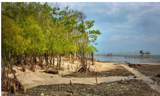
Foto: Kawasan risiko hakisan pantai di Pantai Rekreasi Punggor, Kampung Punggor, Batu Pahat.