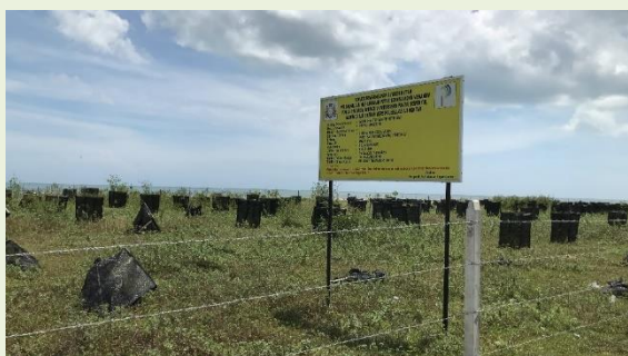
Foto: Gambar kawasan penanaman pokok rhu pantai di kawasan Pantai Semanyir, Mersing