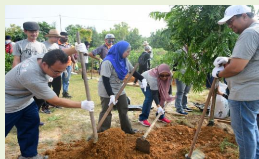
Foto: Penanaman Pokok Rhu di Sepanjang Pesisir Pantai Remis .