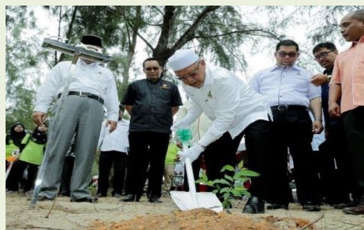
Foto: Penanaman Pokok Rhu Pantai Di Pantai Senok