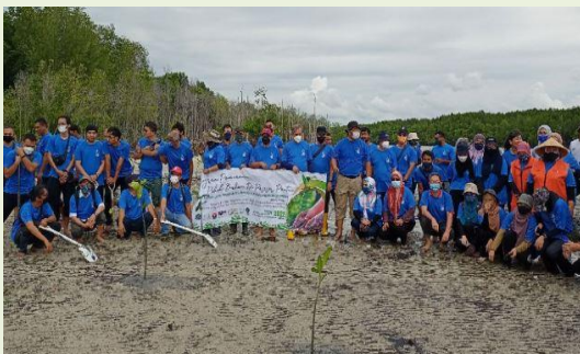
Foto: Peserta Program Tanaman Pokok Pesisir Pantai Di Muara Sungai Sepang Besar.