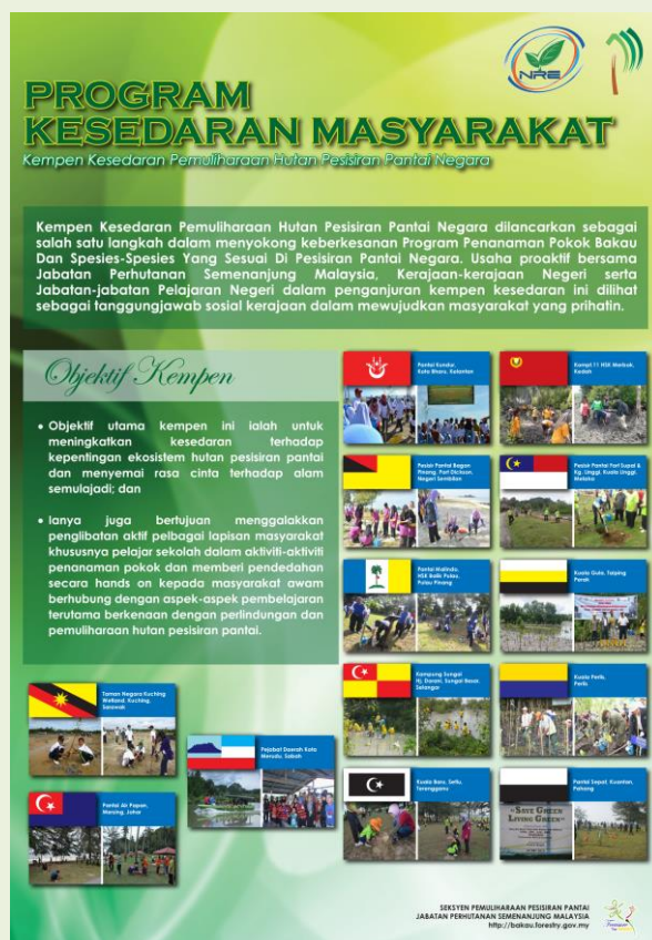
Foto: Poster Kempen Kesedaran Pemuliharaan Hutan Pesisiran Pantai Negara