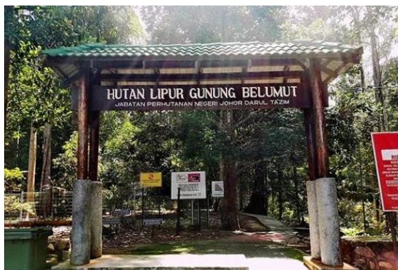
Foto: Hutan Lipur Gunung Belumut, Kluang.