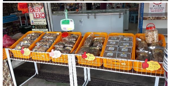
Foto: Antara aktiviti dan produk yang dihasilkan di dalam program-program di bawah Pusat Komuniti Desa