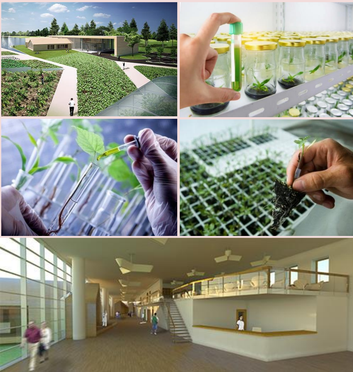
Foto: Contoh gambaran Cadangan Pusat Penyelidikan Agro Desa yang berpusat di Taman Pertanian Johor, Kong-Kong yang berfungsi menyediakan perkhidmatan penyelidikan secara saintifik dan teknikal untuk aktiviti pertanian.