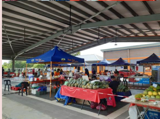
Foto: Pasar Tani Kekal Datin Halimah, Larkin, Johor Bahru yang beroperasi setiap hari (Jam 8am hingga 2pm) kecuali hari Selasa.