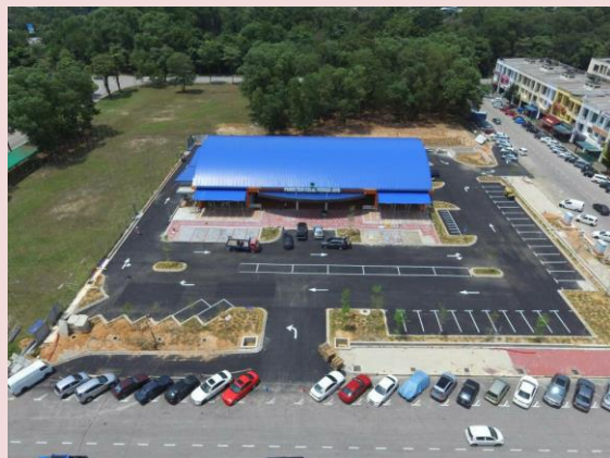
Foto: Pasar Tani Kekal Permas Jaya, Johor Bahru yang beroperasi setiap hari (Jam 7am hingga 3pm) kecuali hari Isnin.