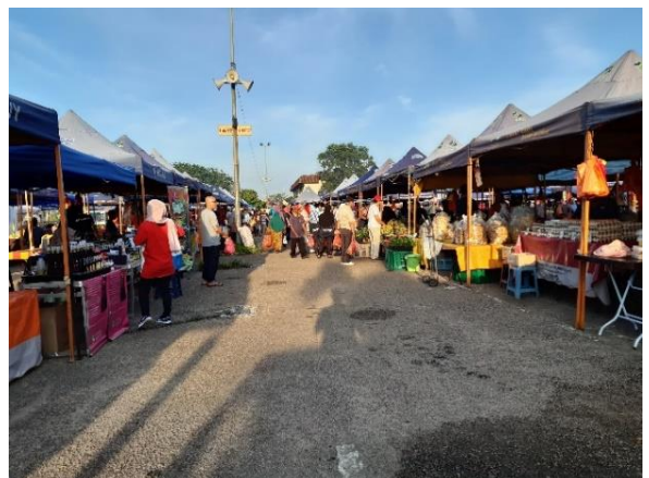
Foto: Pasar Tani Jalan Datin Halimah, Larkin, Johor Bahru.