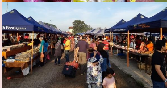
Foto: Aktiviti Pasar Tani Datin Halimah, Larkin, Johor Bahru yang dijalankan setiap hari Sabtu menawarkan pelbagai aktiviti perniagaan termasuk gerai sayur-sayuran, buah-buahan, ikan, daging segar, ayam, makanan dan produk IKS.

Pasar tani berkonsepkan jualan langsung, di mana petani dan penternak berpeluang menjual barangan mereka secara langsung kepada orang ramai tanpa melalui orang tengah / pemborong serta menawarkan harga yang lebih murah berbanding pasar biasa.