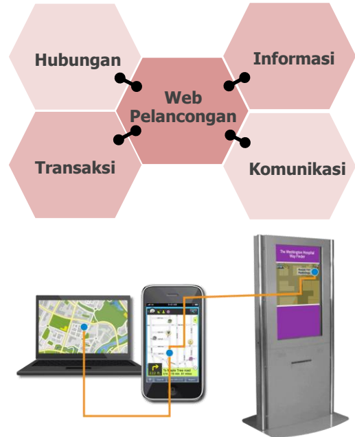
Foto: Perhubungan (Linkages) antara Laman Sesawang, Aplikasi Telefon dan Kiosk Pelancongan