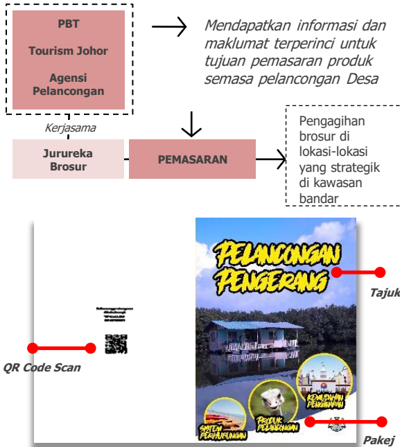
Foto: Contoh Muka depan dan belakang brosur yang interaktif dan informatif