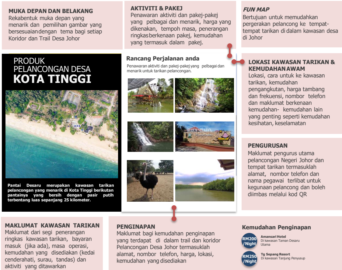
Rajah 4.36: Model Cadangan Pembentukan Brosur Pelancongan Desa Yang Informatif Dan Interaktif